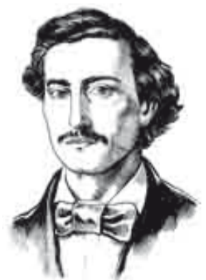
БРАНКО РАДИЧЕВИЋ 1824-1853