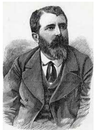
ЂУРА ЈАКШИЋ 1832-1878