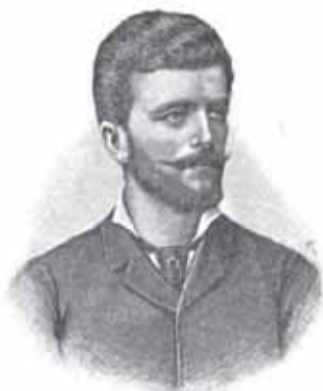
ВОЈИСЛАВ ИЛИЋ 1862-1894