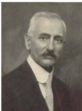
АЛЕКСА ШАНТИЋ 1868-1924