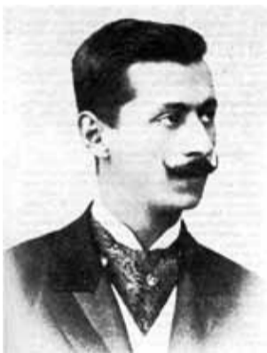
ЈОВАН ДУЧИЋ 1871-1943

01.10. - КЊИЖЕВНО ВЕЧЕ ПОЕЗИЈЕ, ПАТКОВАЧА, 19:00 ЧАСОВА